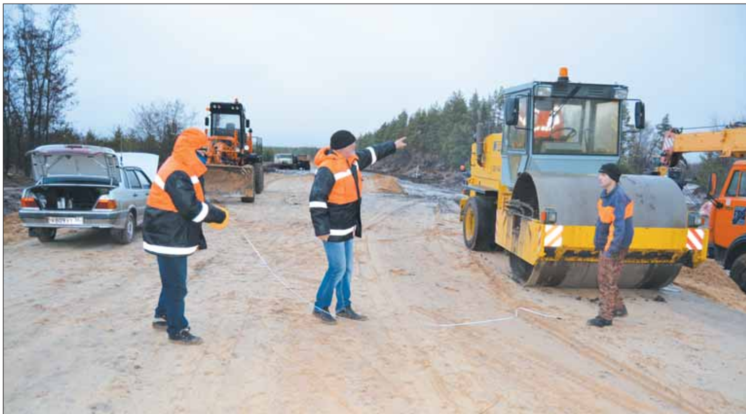
Дорожники активно используют каждый погожий день

Ввод транспортной артерии Журавка – хутор Лукьянчиков в июле 2016 года должен решить проблему коммуникации сразу четырех районов