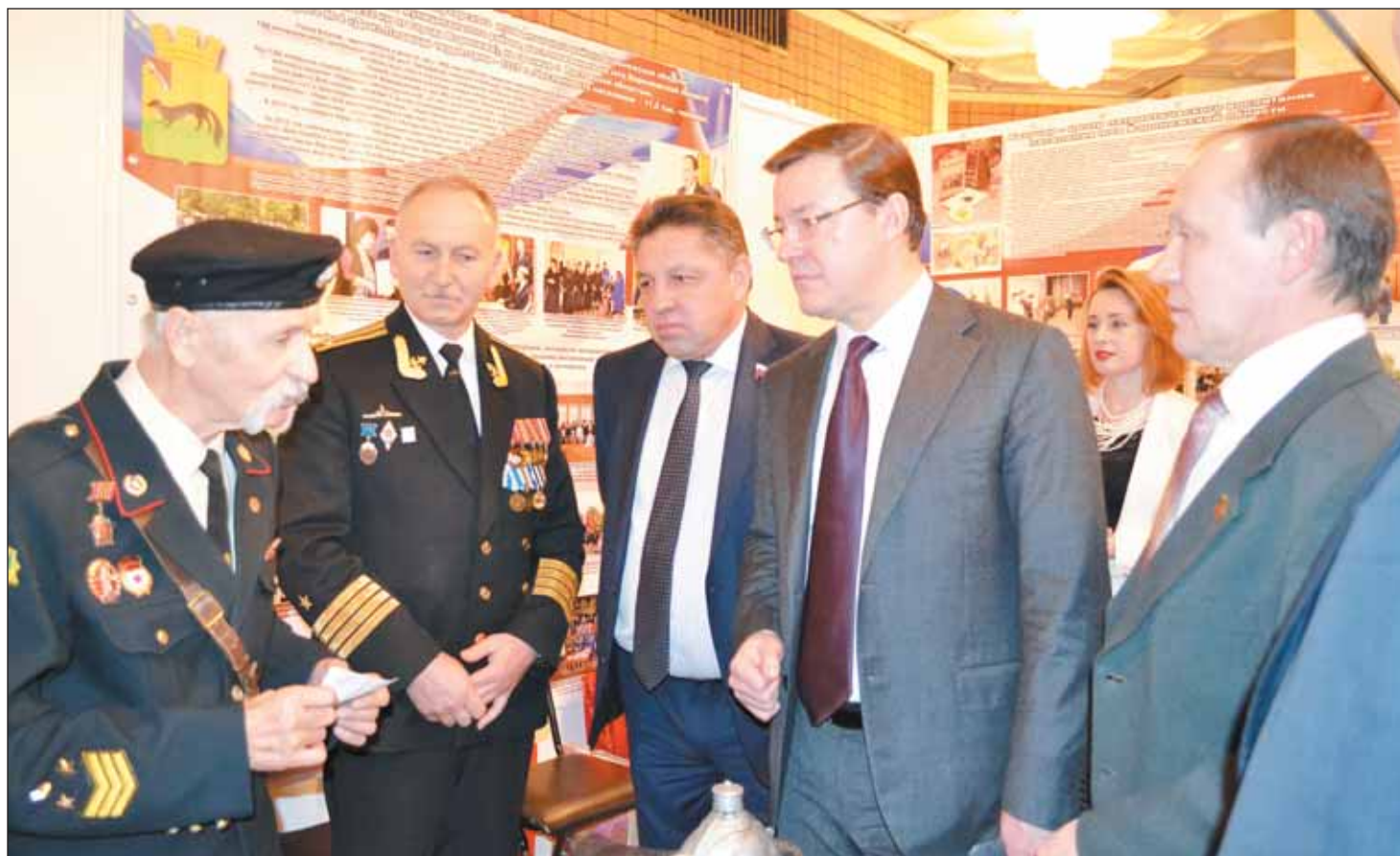
На фото: богучарцы с председателем Совета Федерации по местному самоуправлению Дмитрием Азаровым и председателем экспертного совета ВСМС Вячеславом Тимченко

Наш район в широком формате развернул тему патриотического воспитания населения